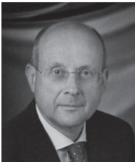
Prof. Dr. Ferdinand Kirchhof